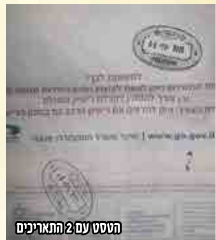
הטסט עם 2 התאריכים