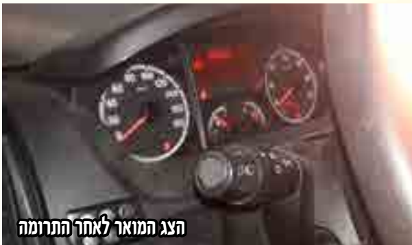
הצג המואר לאחר התרומה

כמה מצער וכואב, אך רק אז נזכרנו: "והוא סגולה לכל דבר" הבטיח לנו כ"ק מרן אדמו"ר שליט"א.