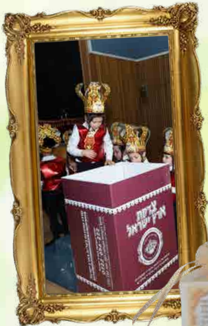
האווירה מחושמלת לגמרי.

הילד ניגש אל הקופה ומשלשל את המטבע לצדקה, כשבאותה שעה אימו מתפללת ומתחננת עבורו למען תזכה שבנה יקירה יזכה לגדול בתורה ובמצוות ובמעשים טובים.