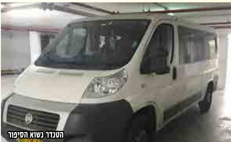
הטנדר נשוא הסיפור